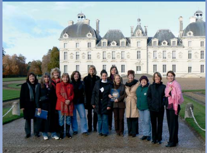
Le groupe de tour opérateurs devant Cheverny

Les premiers résultats enregistrés pour la saison 2007 étaient plus que positifs. Le succès de notre destination s'explique à la fois par un « report » de la clientèle française et par un accroissement des clientèles étrangères.